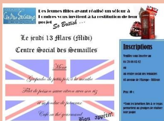
Table d'hôtes : repas du projet So British @

Les centres sociaux soutiennent depuis plusieurs mois maintenant, le projet "So British" d'un groupe de 8 jeunes filles qui partent à Londres.